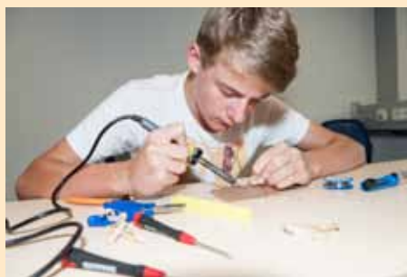
Auch das war Teil der JuniorAkademie: die Schüler programmieren und bauen kleine embedded Computer zusammen.

Vom 4.–18. August ging die JuniorAkademie Bayern in die nächste Runde. Auch heuer kamen 40 Schülerinnen und Schüler in den Ferien ins fränkische Pottenstein, um sich von hochrangigen Dozenten für die Wissenschaft begeistern zu lassen. In vier Fachkursen befassten sie sich mit »Mathematik zur Musik«, »Physik-Experimenten«, »Gegenwartstheater, Theaterspiel, Performancekunst« und »Multimedia-Programmierung«. Veranstalter der JuniorAkademie ist das Fraunhofer IIS.