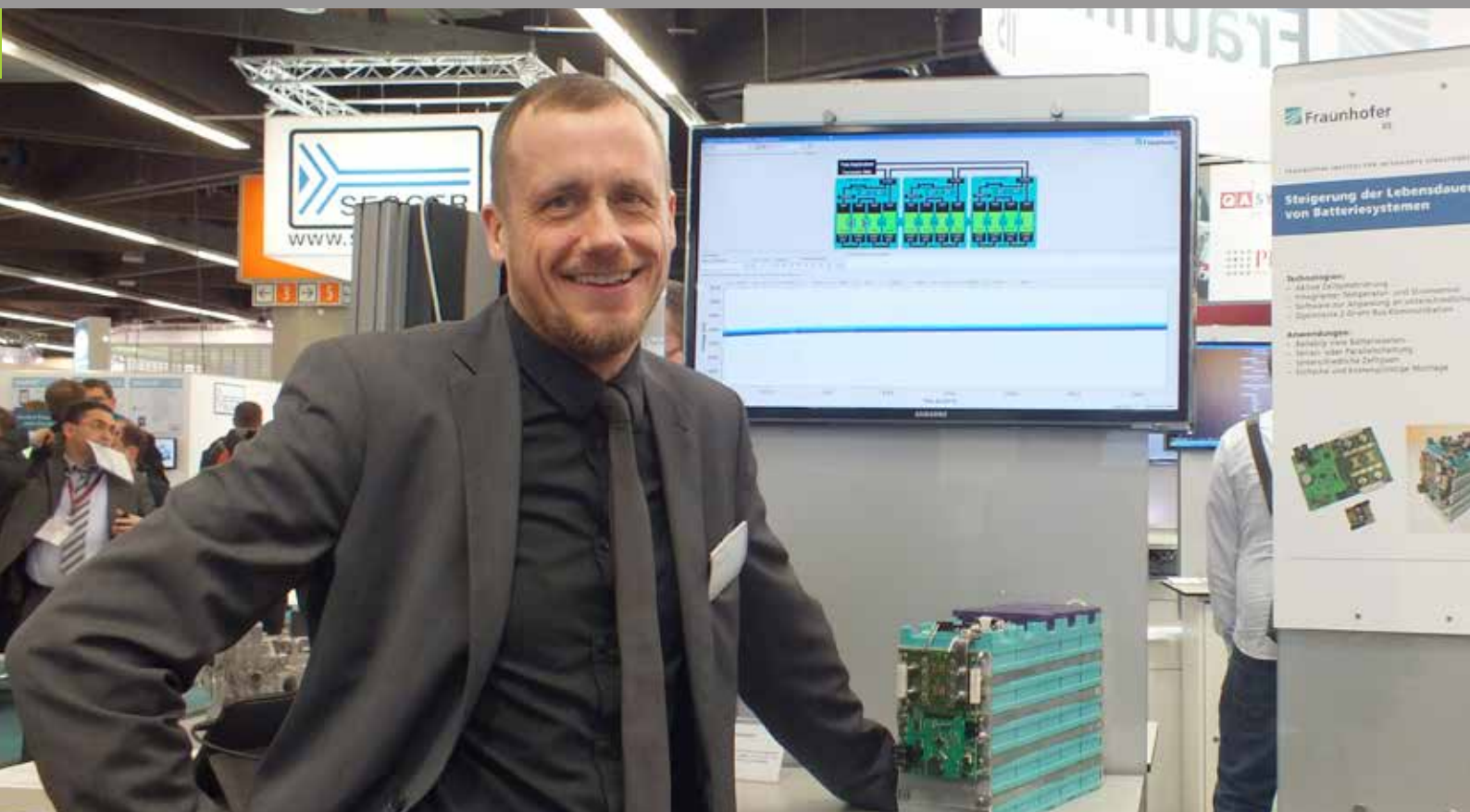
Das Batteriemanagementsystem des Fraunhofer IIS verbessert Leistung und Qualität von Akkus.

Newsletter des Fraunhofer IIS in Kooperation mit dem Förderkreis für die Mikroelektronik e. V.