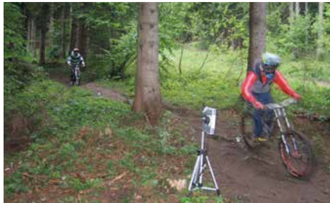
Zwei Downhiller testen das System in Innsbruck.