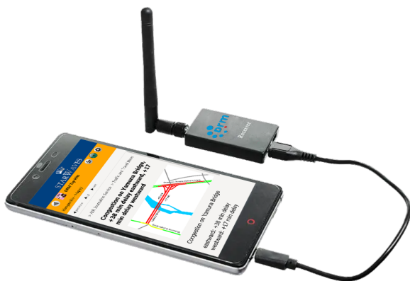
STARWAVES DRM SoftRadio App Logo © Starwaves

Mit nur einem kleinen USB-Radio-Dongle werden Android-Smartphone und -Tablet zu mobilen DRM-Empfängern © Starwaves